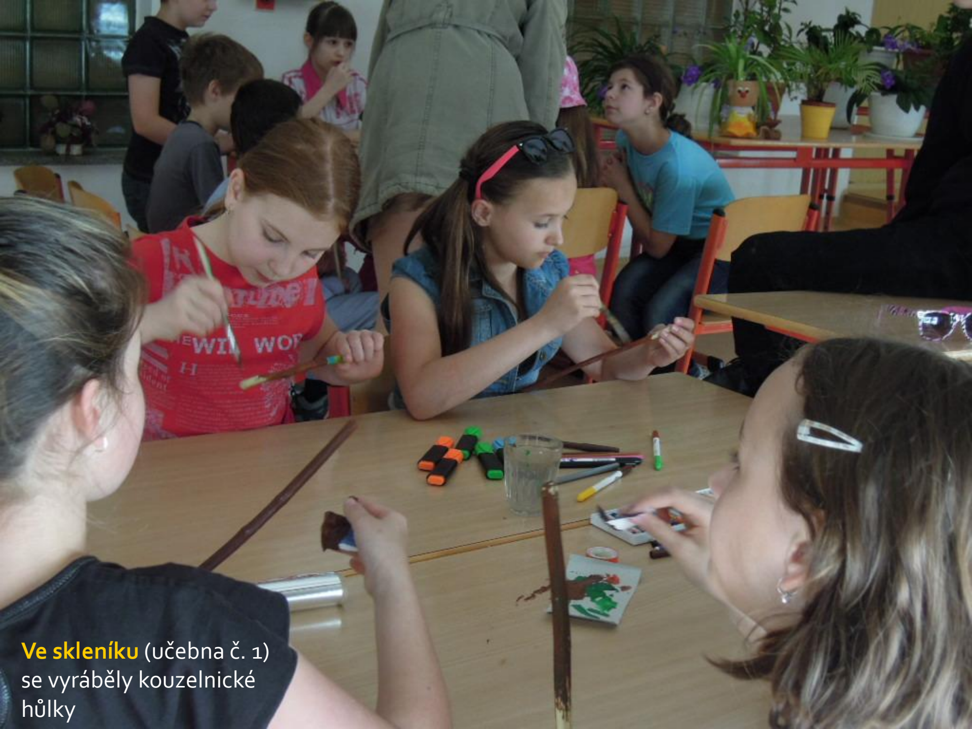
Ve skleníku (učebna č. 1) se vyráběly kouzelnické hůlky